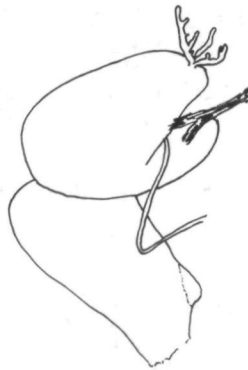
Abb. 3: Deroceras liebegotti nov. spec., Holotypus, Penis.